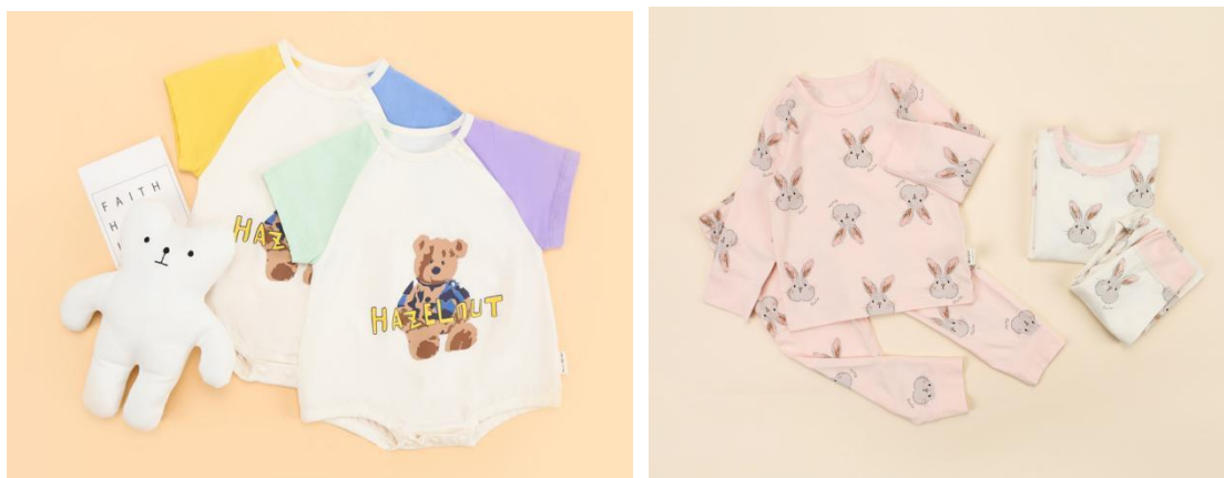
公司“寓教于乐”的超预期需求的案例

让宝贝在牙牙学语的时候认识世界。基于“同理心”换位思考，站在妈妈的角度呵护宝贝，赋予产品超预期需求价值。