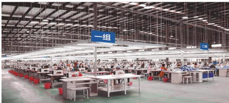
公司外协加工厂生产管理现场效果图