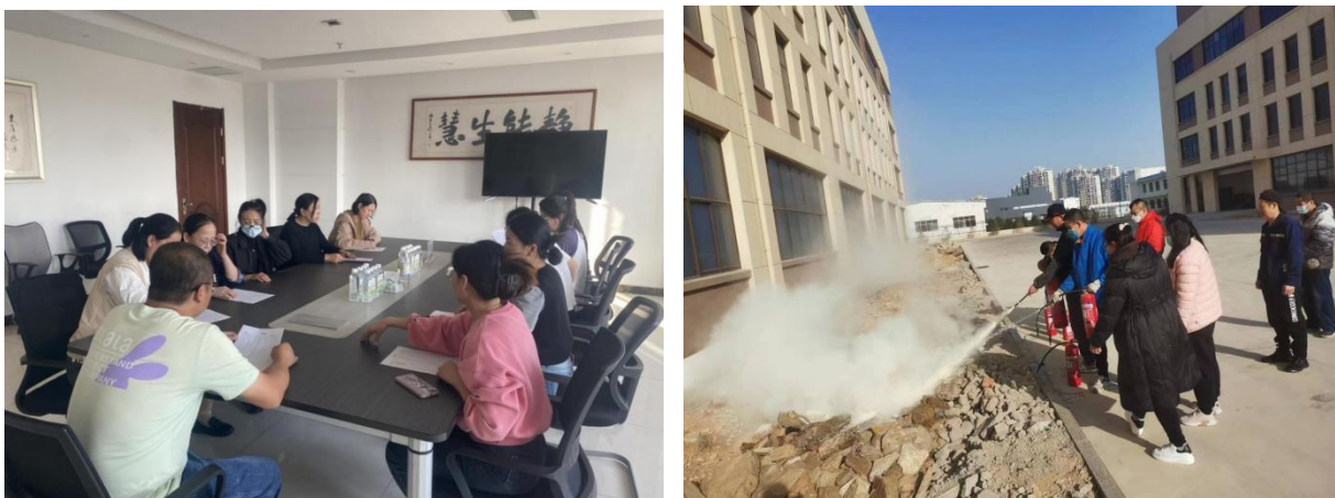
公司员工安全教育培训图

公司在开展安全宣传教育采取请专家培训、观看安全教育视频、结合岗位安全特点分岗培训等。制定《安全教育管理制度》《安全隐患排查管理制度》等，坚持新员工三级安全教育。充分利用安全专题会、中层干部会议、全体员工会议等部署、宣传、传达安全工作，让全体员工意识到“以人为本、关爱生命”的安全工作理念，提出从“自己不受伤害”到“保护他人不受伤害”的安全意识转变。公司对全体员工进行安全教育培训，定期进行安全法律法规的宣传，安全事故的案例分析，开展全员安全教育。