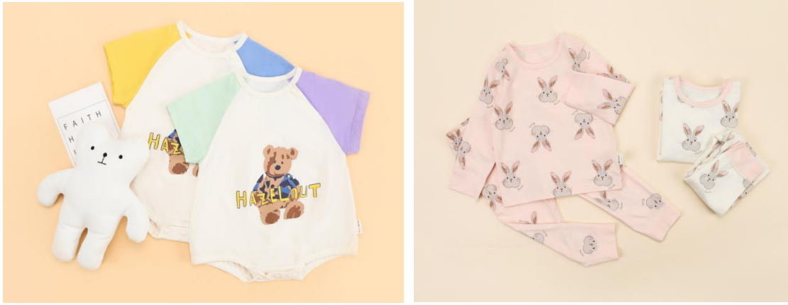
公司“寓教于乐”的超预期需求的案例