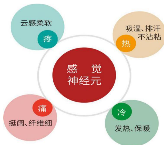
公司研发设计部门对影响婴幼儿舒适性解析模式图

公司从婴幼儿皮肤中感觉神经元入手，对产品舒适性进行研究。根据中国工程院姚穆院士研究发现，冷感和热感所测的不是温度而是和皮肤的温差。公司成立“儿童服装舒适性‘痛点’”技术攻关小组，由研发总监挂帅，并制定了攻关工作管理办法，设立技术攻关奖励基金。公司根据科学研究和市场调研，得出婴幼儿接触衣服时对棉织物的基本特性要求是挺阔、吸湿、排汗、不沾粘、纤维细软、夏季凉爽、冬季保暖等。公司因地制宜采用高纱支大棉田的精梳棉纺纱织布，利用其面料吸湿排汗及柔软的独特性能，更深层的保护宝贝娇嫩的肌肤，为宝贝调控身体温度，使宝贝不易感冒和着凉。让衣拉拉的新衣成为宝贝的第二层肌肤。