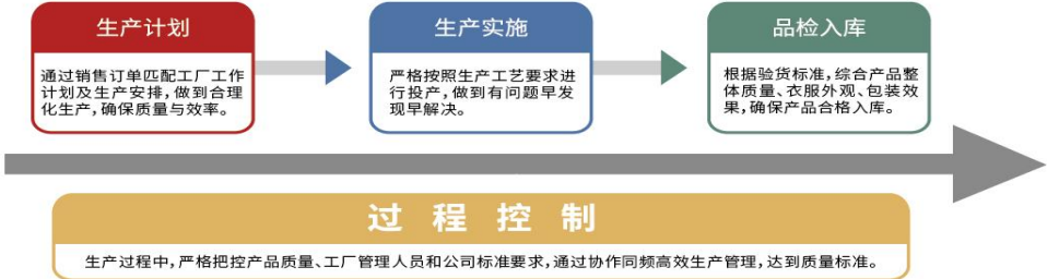
公司 OEM 生产管理示意图

公司将 OEM 生产管理过程划分为三个阶段：生产计划、生产实施、品检入库，对所有外协工厂实施流程化、规范化过程管控，现场跟踪工序生产，逆向追查问题原因，及时进行专业指导，并对接同品类其他外协工厂，联动规避同类问题的发生。